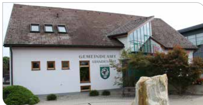
Gemeindeamt im August 2020