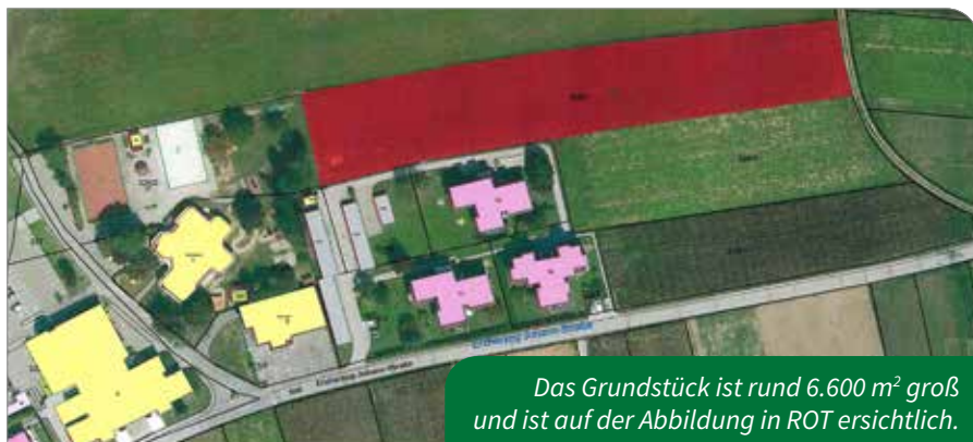
Das Grundstück ist rund 6.600 m 2 groß und ist auf der Abbildung in ROT ersichtlich.

unmittelbarer Nähe des bestehenden Kindergartens bzw. in Verlängerung der Trendsportanlage in Richtung Osten. Die Zusage der Grundstückbesitzer liegt vor und der Kaufvertrag ist in Ausarbeitung. In der Gemeinderatssitzung vom 17.09. werde ich den Antrag stellen, dieses Grundstück zu erwerben.