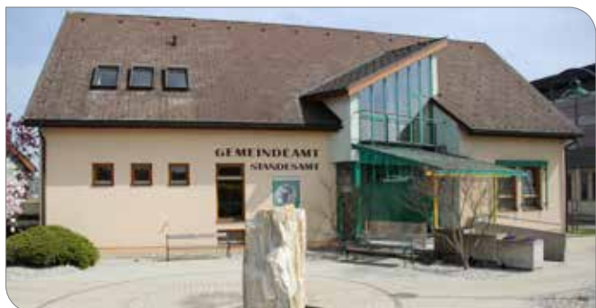
Gemeindeamt im April 2016

Eintritts von Oberflächenwasser im Untergeschoss wird es auch in diesem Bereich zu umfangreichen Arbeiten kommen. Die Gesamtkosten für all diese Aufwendungen werden sich daher auf ca. € 120.000 belaufen.