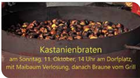
In diesem Sinne wünsche ich Ihnen und Ihrer Familie einen schönen Herbst.

KASTANIENBRATEN // Das Maibaum-Umschneiden fällt heuer aus bekanntem Anlass aus. Am 11.10. findet das Kastanienbraten statt. Bei dieser Veranstaltung wird auch der heurige Maibaum verlost. Es würde mich freuen, Sie bei unserer Veranstaltung willkommen heißen zu dürfen.